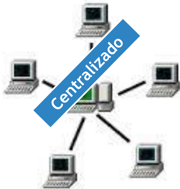
Server Based Network